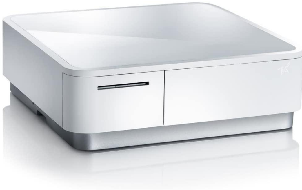
Star mPOP kassalaatikko - tulostin ja rahalaatikko yhdessä laitteessa