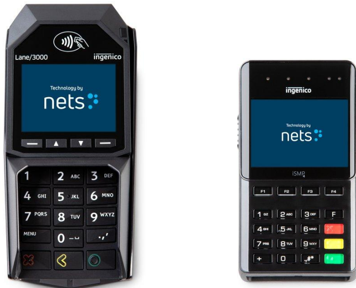
Nets Lane 3000 (vasemmalla) ja Nets iSMP4 (oikealla)