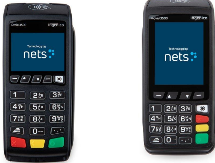
Nets Desk 3500 (vasemmalla) ja Nets Move 3500 (oikealla)